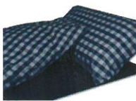
Vichy Navy (VN)