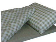
Vichy Cappuccino (VC)