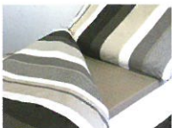
Coffee & Cream (CC)