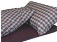
Vichy Prune (VP)