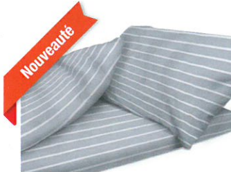
Rayé Gris (RG)

Les produits DUVALAY sont disponibles en 5 coloris, 3 vichy et 2 rayés :